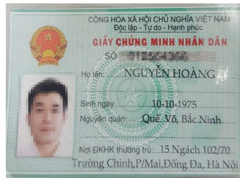
hoặc Giấy chứng minh nhân dân còn hiệu lực