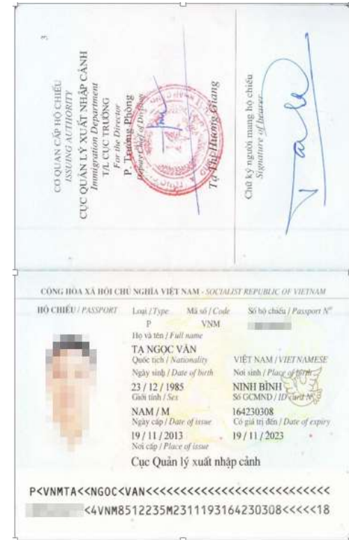
hoặc Hộ chiếu còn hiệu lực