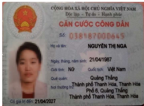
Thẻ căn cước công dân còn hiệu lực